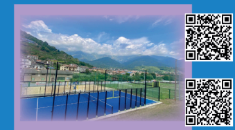
Illustrazioni: marita bianchi - Ideazione, studio impaginazione: ...

L'area camper vanta 8 posti per camper con lunghezza massima di 8m, l'allaccio all'elettricità, servizi WC, doccia, lavabo per stoviglie e un bar. (info e prezzi scansionando il QR code o in loco).